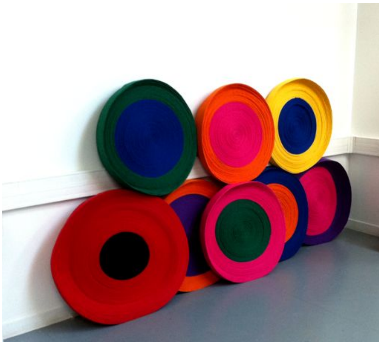
«Monument aux mains 1»