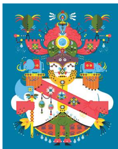
Costume Impression digigraphique 40 x 50 cm