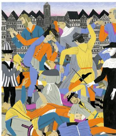
Fanny BLANC La peste dansante Gouache et crayons 21 x 26 cm