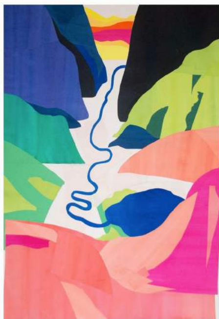
Jérémie FISCHER Paysage Collage 35 x 50 cm