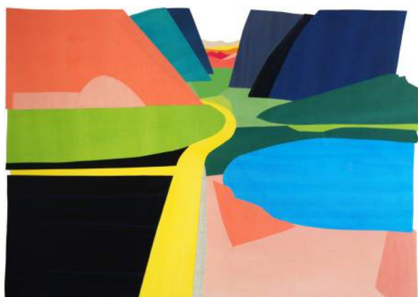
Paysage Collage 100 x 70 cm

La sortie de son livre animé Wild About Shapes chez Flying Eye Books est prévue pour mars 2015, une édition qui bénéficiera d'une sortie française cet automne chez Les Grandes Personnes.