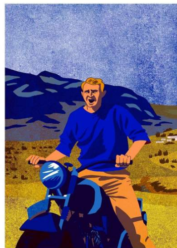
Steve Mc Queen Sérigraphie imprimée en 4 couches 70 x 50 cm