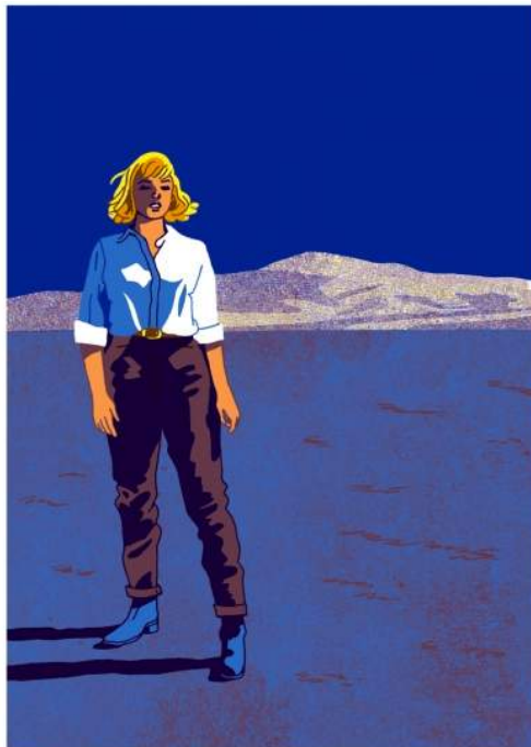
Simon ROUSSIN Marylin Sérigraphie imprimée en 4 passages sur papier munken 70 x 50 cm