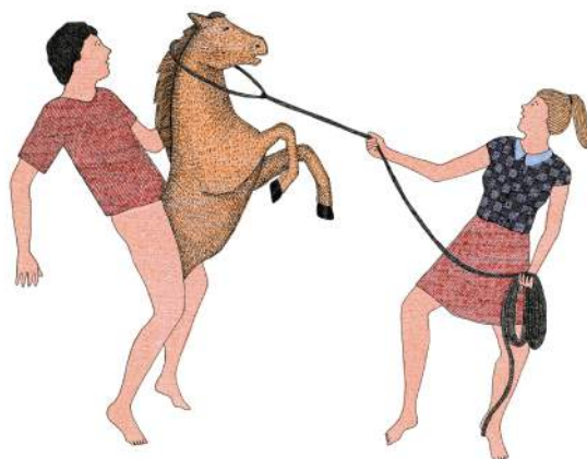
Marion FAYOLLE Les coquins Transfert d'encre et encre de chine 21 x 29,5 cm