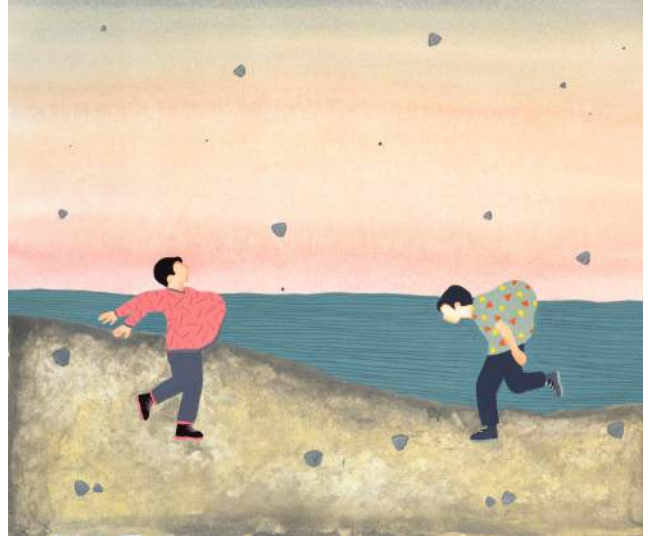
Margaux Othats Un jour dehors Gouache 40 x 35 cm