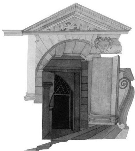
Monument Lavis d'encre 26 x 36 cm

Au delà de sa participation régulière à la revue Nyctalope , ses dessins sont aussi publiés dans une autre revue d'illustrations et de bandes dessinées : Belles illustrations . Elle collabore également régulièrement avec la presse, comme par exemple le New York Times , Vanity Fair , Kibлинд ou encore Influencia dans lesquels elle a vu plusieurs de ses illustrations publiées.