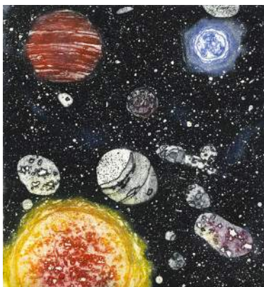
Galaxie Gravure à l'eau forte sur cuivre 28 x 29,5 cm