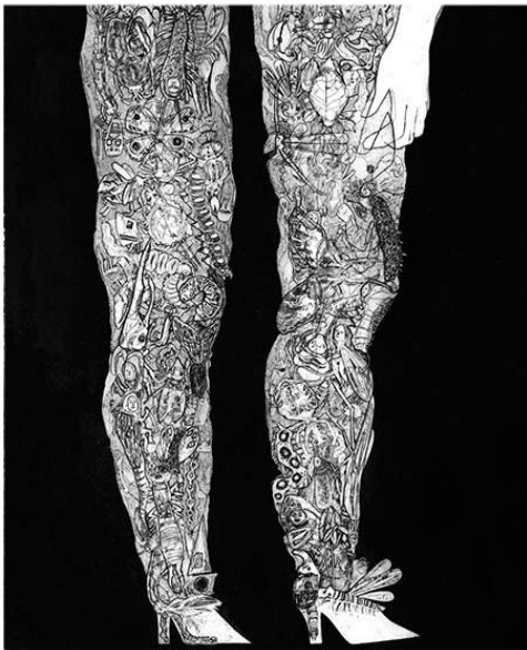
Marine RIVOAL Jambes Eau forte au scotch et aquatintes sur cuivre 56 x 72 cm