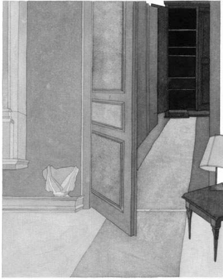
Bénédicte MULLER Monument Lavis d'encre 26 x 36 cm