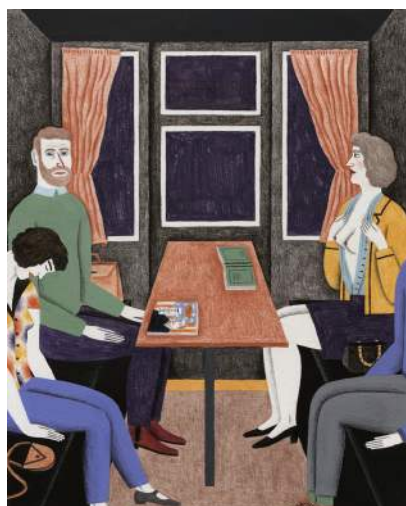
Le train Gouache et crayons 20 x 24 cm

Le récit historique, les images du passé et l'imagerie populaire la fascinent, c'est de ces univers que se nourrit souvent son imaginaire. En parallèle de ses projets éditoriaux, elle est illustratrice pour la presse, notamment pour le New York Times (2014), la Revue XXI (2014) et la Revue Citrus (2015). Fanny Blanc entame également une collaboration pour un court métrage d'animation.