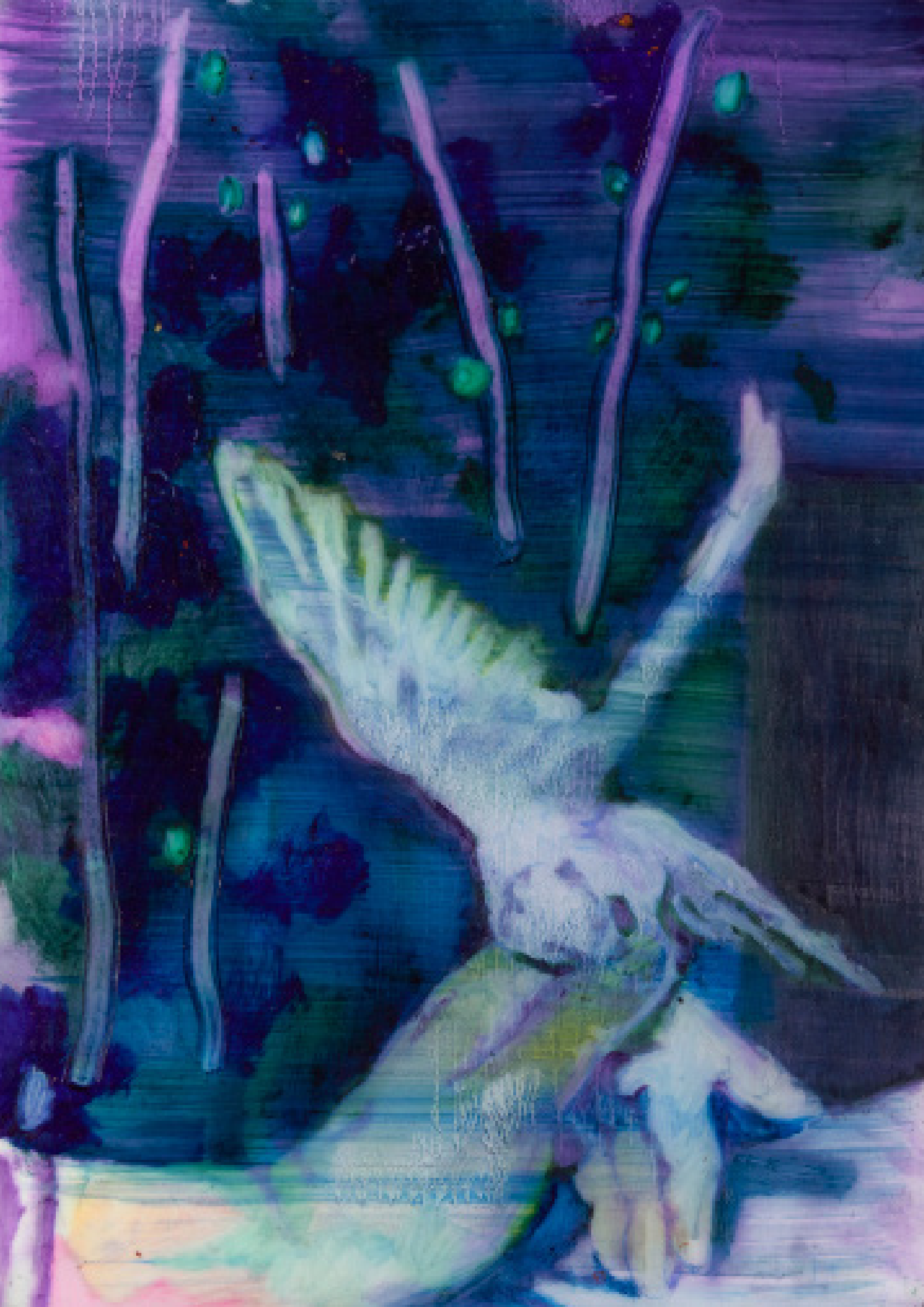
Sarah Jérôme, Les passagers 1 , peinture à l'huile sur papier calque, 40 x 30cm, 2025, courtesy H Gallery