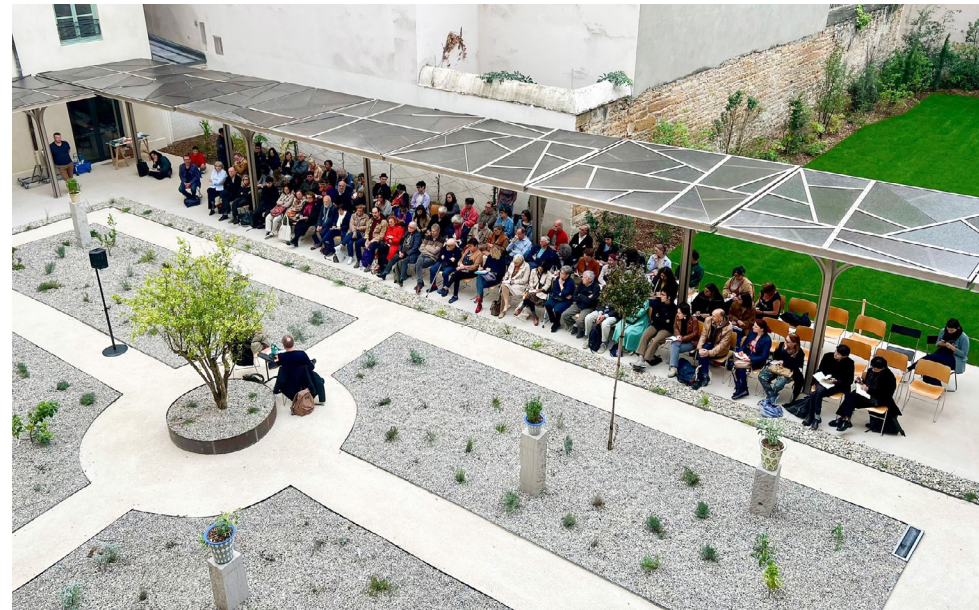
Vue du jardin de la Fondation Bullukian