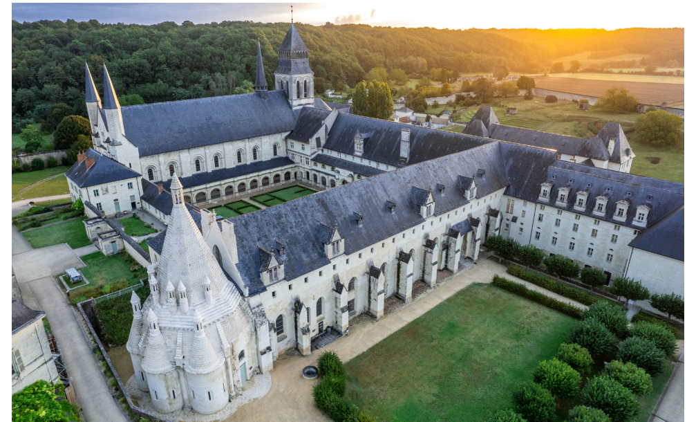
Vue du l'Abbaye royale de Fontevraud