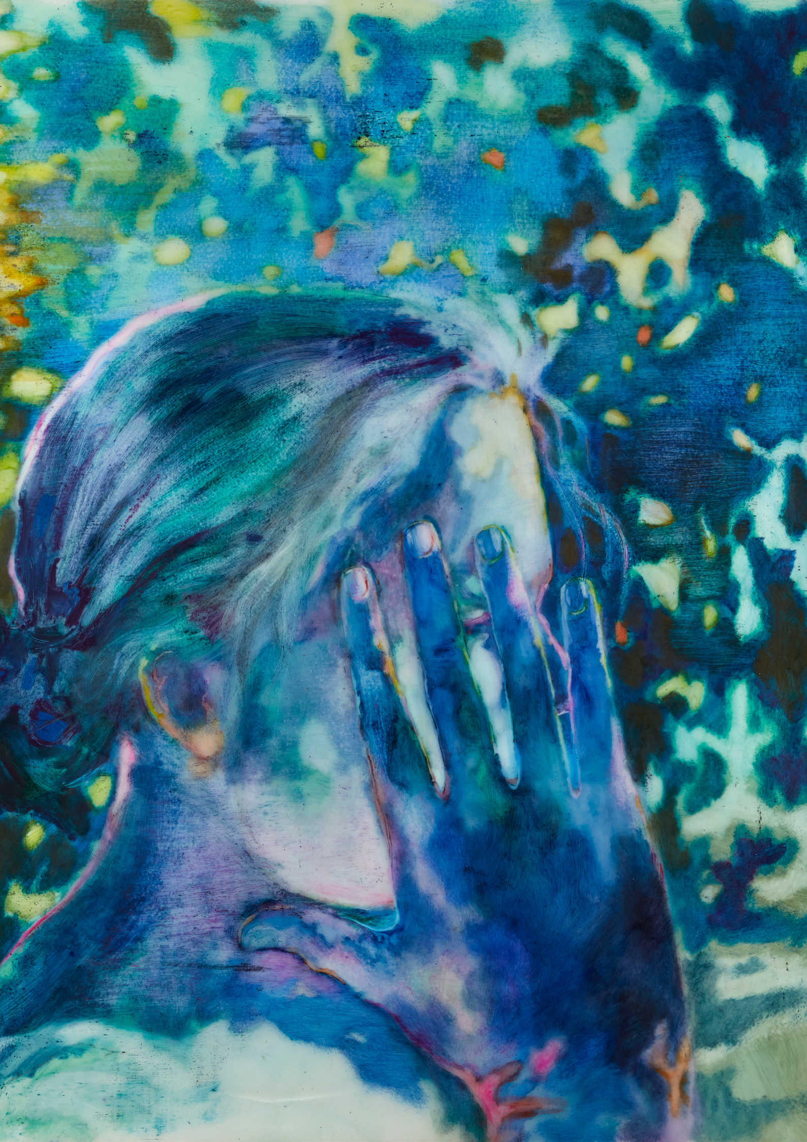
Sarah Jérôme, Aura , peinture à l'huile sur papier calque, 152,5 x 120cm, 2025