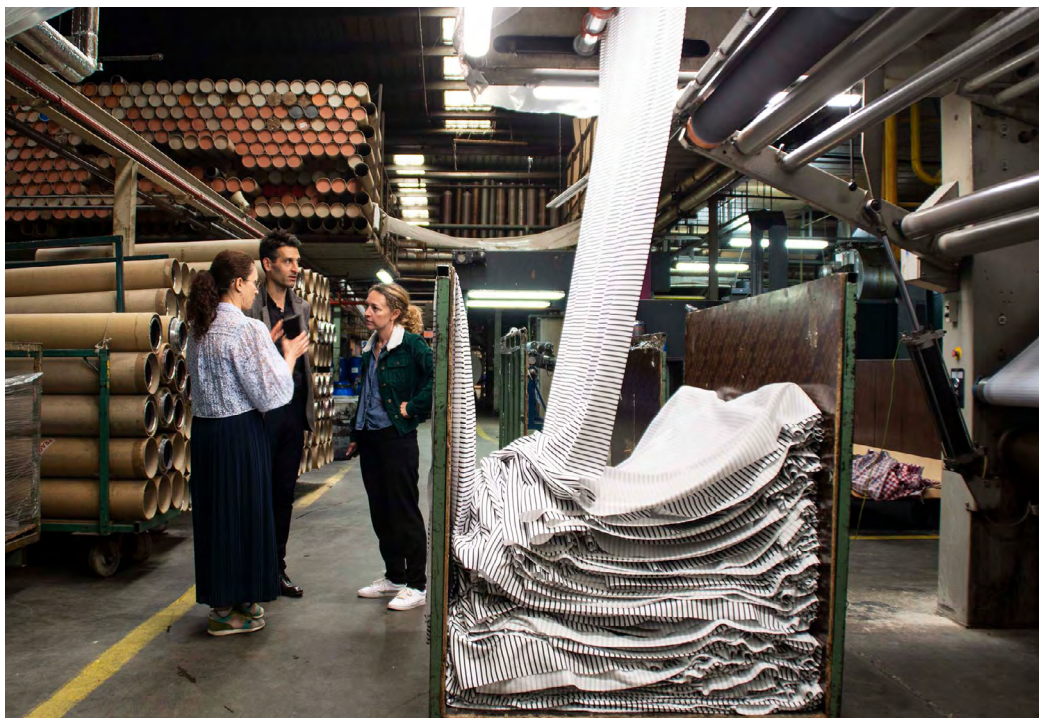
Visite des Teintureries de La Turdine 2022

À l'occasion de l'exposition Destination de nos lointains , la Fondation Bullukian et l'artiste François Réau s'associent aux Teintureries de La Turdine situées à Tarare (Rhône) et à Piolat Rotary (Isère) pour la création d'un dispositif inédit présenté dans l'espace Boissac du centre d'art.