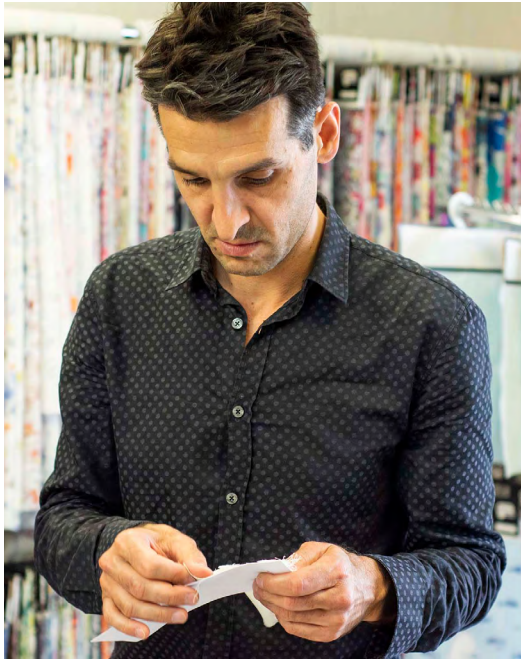
Portrait de l'artiste François Réau