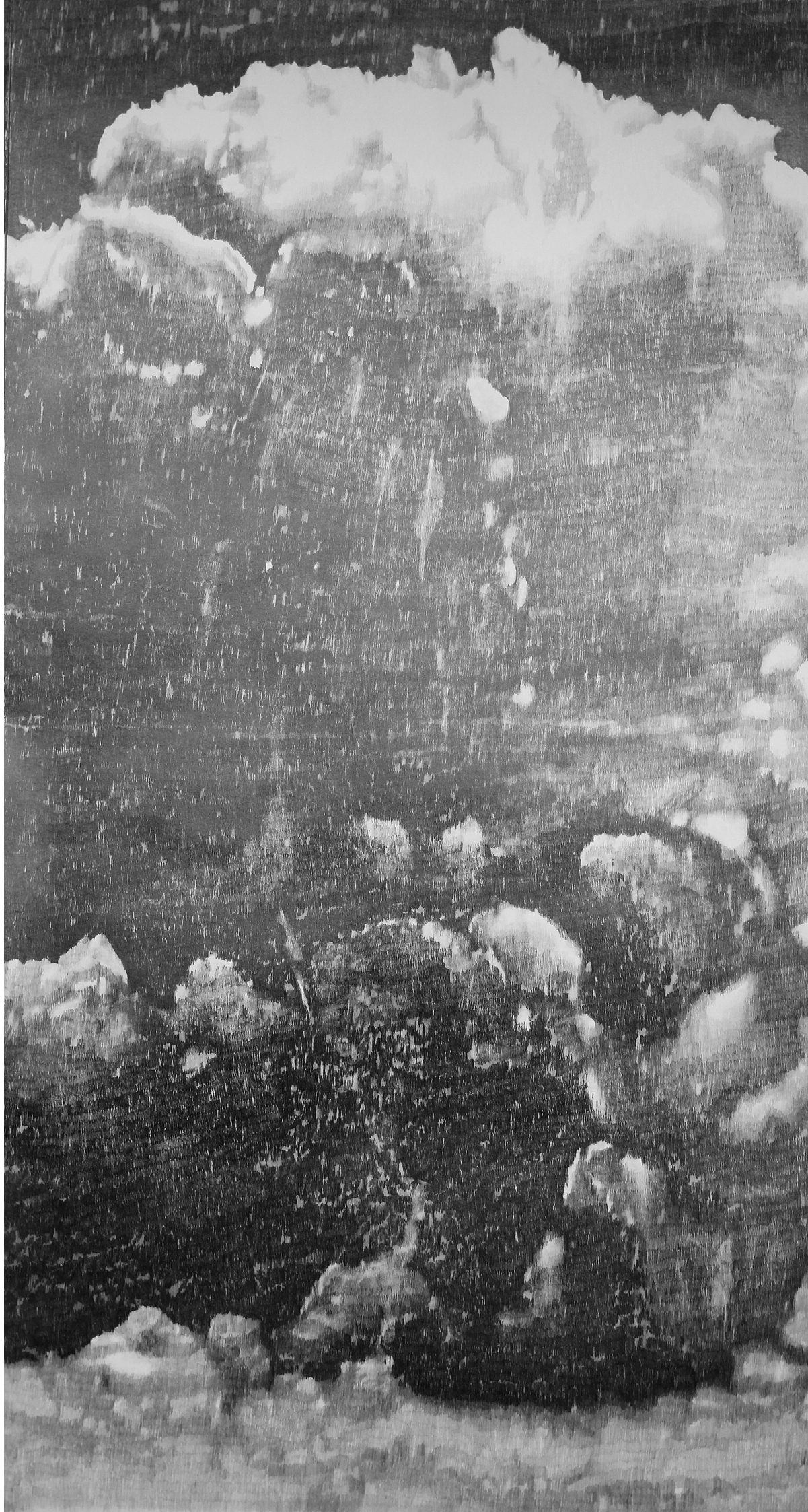
François Réau To what extent / Nuage (détail) , 2022, Mine de plomb sur papier marouflé sur toile, 200 x 375 cm © François Réau