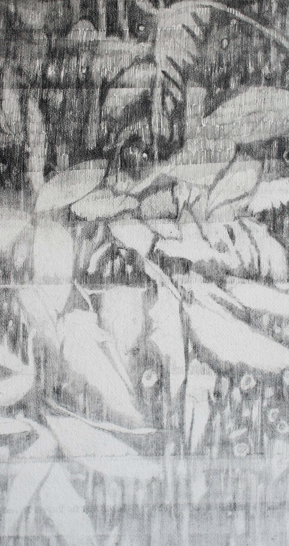
François Réau Et le feuillage (détail) , 2018, Mine de plomb et graphite sur papier, 50 x 30 cm © François Réau