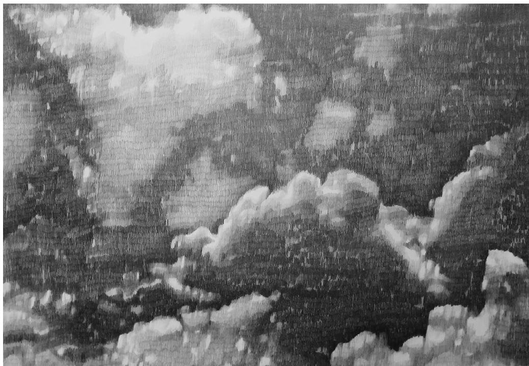
François Réau To what extent / Nuage (détail), 2022, Mine de plomb sur papier marouflé sur toile, 200 x 375 cm © François Réau

« Il s'agit d'un dispositif dans lequel je cherche à pousser les limites du dessin. J'ai souhaité proposer une œuvre qui fasse référence directement à la Nature ou à l'espace du paysage mais qui, d'une certaine façon, soit un symbole de ce qui échappe à la représentation. Il me semblait important aussi d'amener le regardeur à avoir, avant tout, une expérience de l'image qui puisse l'excéder physiquement, et ce, en donnant à l'œuvre une taille assez grande pour qu'elle perde son entité d'objet. Elle pourrait ainsi être perçue comme un champ de vision.