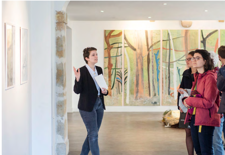
Visite commentée de l'exposition « Oniric landscapes » de Charlotte Denamur, Vanessa Fanuele, Frédéric Khodja et Christian Lhopital, 2022