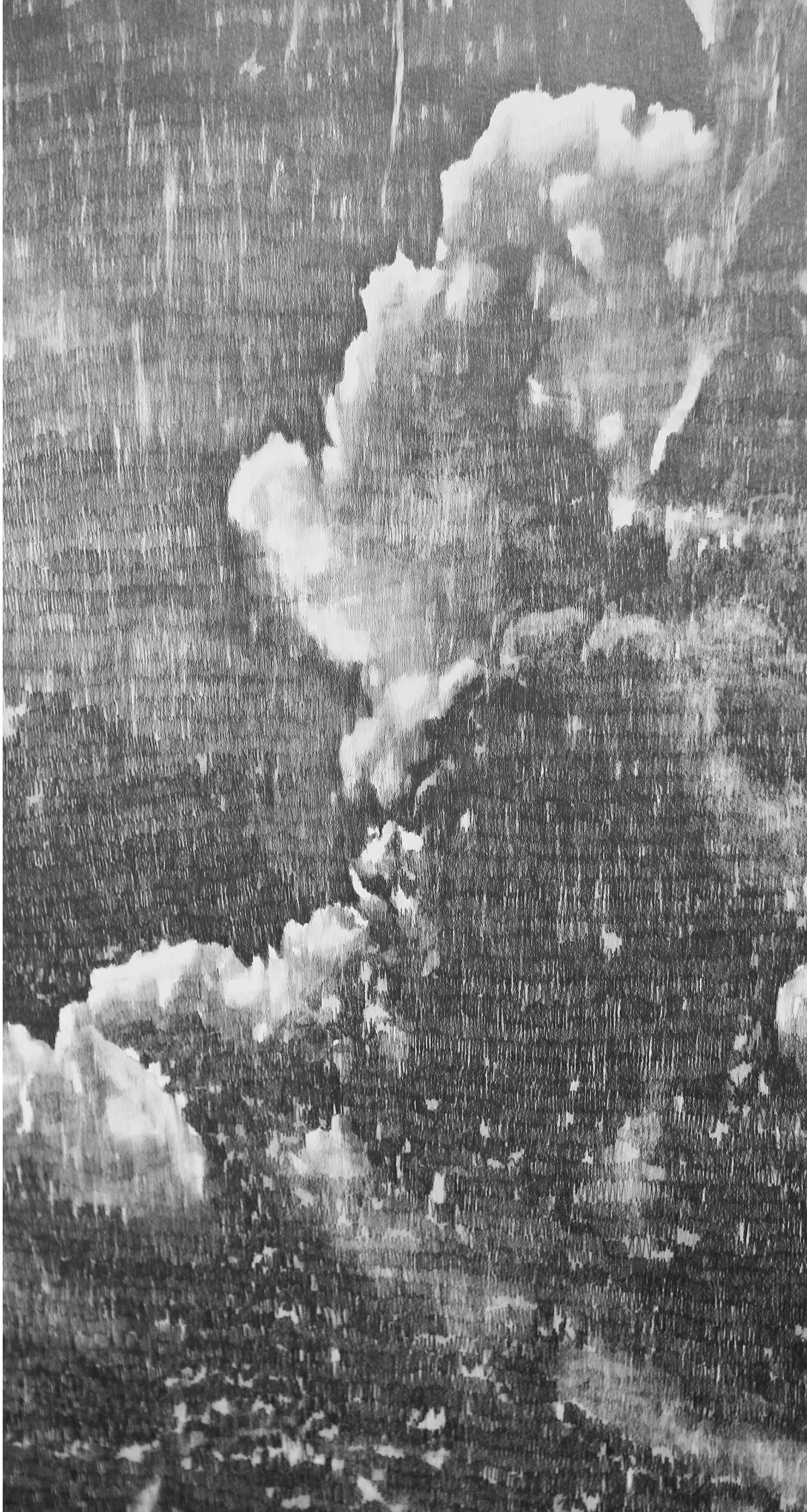
François Réau To what extent / Nuage (détail), 2022, Mine de plomb sur papier marouflé sur toile, 200 x 375 cm