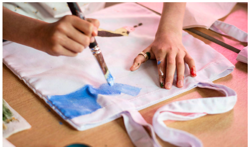
Atelier Bullu'kids, Exposition « Oniric landscapes », 2022 © Fondation Bullukian

Tous les derniers samedis du mois et pendant les vacances scolaires. Prix : 5 euros, sur réservation : publics@bullukian.com