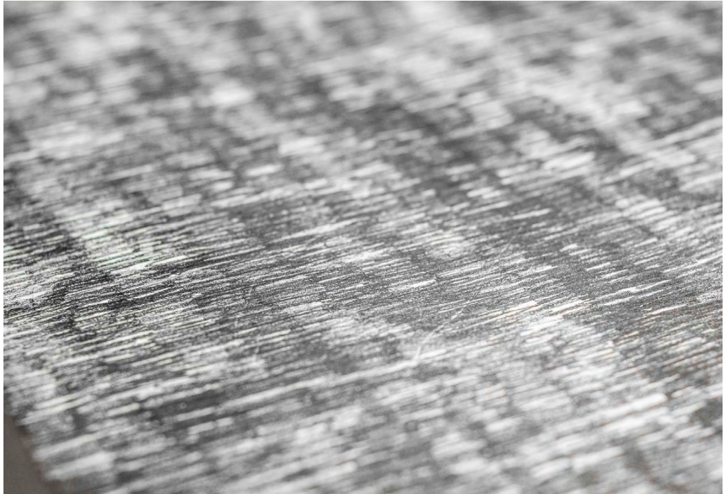
François Réau Mesurer le temps (détail), 2022, Mine de plomb et graphite sur papier marouflé sur toile, 82 x 125 cm

« Le dessin c'est la trace, et la trace est tout autant mémoire qu'oubli. »